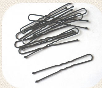
Des Pincés à chignon