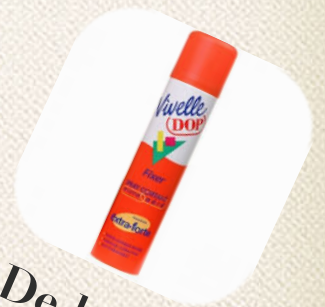
De la Laque